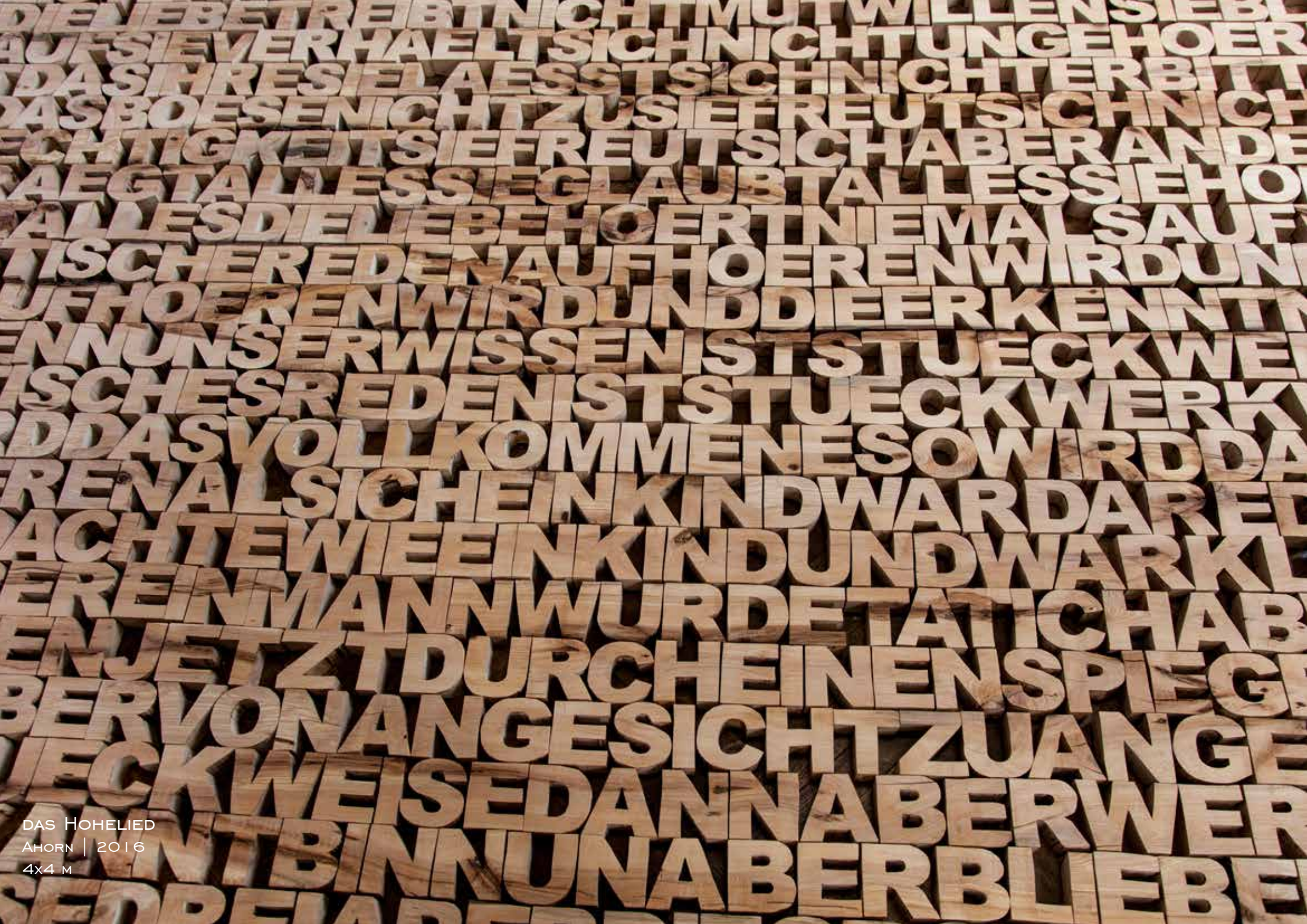
DAS HOHELIED AHORN | 2016 4x4 M